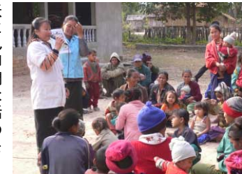
村での聞き取り調査の様子

郡保健局や郡病院見学で感じたことは病院や保健施設などの建物は支援団体からの支援を受け整備されていたが、スタッフのレベルや医療機器、器具、提供される医療に関しては大いに改善の余地があるという事でした。周辺地域における病院の信頼に関しては、聞き取り調査で「体調の悪い人がいたらどうしますか?」という問いに「まずは村のヘルスポストに行き、そこで対応できない場合に病院へ行く」と返答があるように、村人たちの信頼は大きい様でした。改善すべき点はその病院に行くまでの距離(調査した村では「車で1時間ほどかかると」と話していました)や、その病院で適切な医療が受けられるかどうか、今回調査をした以外の村でも同じように病院の信頼性が確立されているかどうかだと思いました。