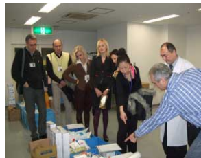
資材部での研修の様様

理論についても聖マリア病院が実践してきた事の裏づけがなされており、優れた教材を研修員に提示していただきました。知識や実践的なスキ