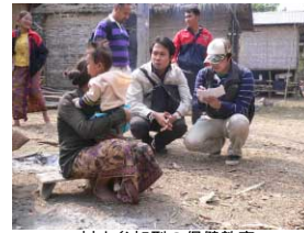
村人参加型の保健教育

国際保健コースの研修としてラオスでの研修をさせていただきました。研修の目標はラオスという地域を通じて医療保健活動を計画することであり、ラオスでの研修以外にも事前の情報収集、計画立案、調査を踏まえての計画修正なども勉強させていただきました。