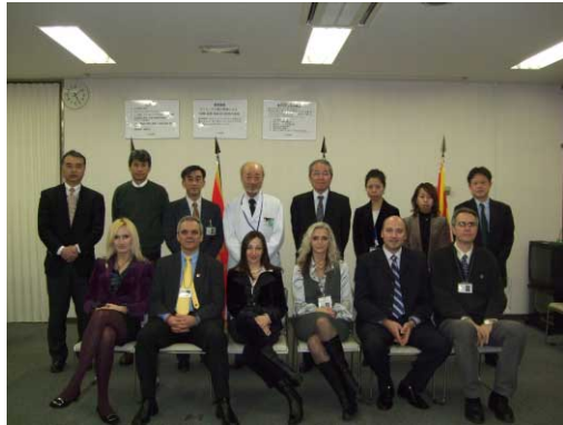
修了式での記念写真 前列一番右の男性が筆者