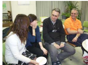
職員交流会での一コマ

分な時間を持つことができました。研修に使用する資料は適切なタイミングで配布され、また各講義は計画された時間どおりに開始され終了しました。各講師の姿勢は常に積極的で、研修員たちの興味を喚起してコミュニケーションを図ろうと努力されていました。