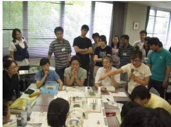
模擬診療を前に打ち合わせ

幼い頃、父から見せられた一枚の写真。何の屈託もない笑顔、澄んだ瞳で写る少年・少女たちの写真でした。話を聞けば、彼らは何日もご飯が食べられず、病院にも行けず、中には病気で親が亡くなった子もいる。「私たちはとても