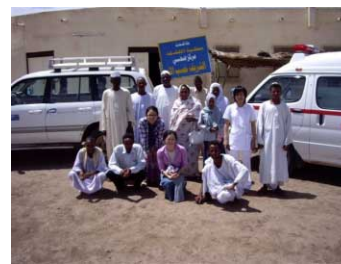
ヘルスセンターでの集合写真