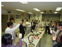
開会に際して全員で乾杯

去る10月6日と10月23日の両日、JICA 研修員と病院職員との文化交流会を開催しました。この交流会は4年前から実施していますが、職員にとっては異文化に接することができる貴重な機会であると同時に、研修員にとっても多くの日本人と知り合う機会となり、