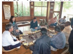
初めての田楽料理を楽しむ研修員

その後、同じ高森町にあるレストランに移動し、皆で昼食を取りました。そこで食べた田楽という料理は、多くの意味で私たちを楽しませてくれました。目の前で、いろんな食材が直火で調理されている間は、それらが放つ良い香りを楽しむことができました。食材に火が通り、食べ頃になると、私たちは串焼きの野菜や魚などを