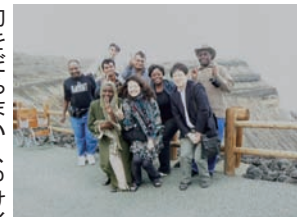
強風で?噴煙が晴れた阿蘇火口

阿蘇山へ向かい、初めて本物の活火山を見ることができると期待に胸を膨らませました。阿蘇山までの途中にも、美しい風景が広がっており、私たちは慌しくあらゆる方向へカメラを向けました。研修員の多くは、良く整備された農地で草を食む牛たちにも注目していましたが、特に私は、その光景から、母国ウガンダの農園で過ごした日々を思い出さずにはいられませんでした。