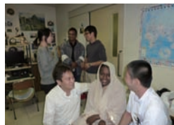
歓談する研修員と職員たち

尚、この交流会では、英語をまったく話せない方の参加も大歓迎です。その場合、周りの者が通訳をして、研修員とのコミュニケーションをサポートしますので、ご安心ください。来年2月にはJICA研修「南東欧地域病院運営コース」の実施に合わせ、次の交流会開催を計画しています。国際交流に少しでも関心がある方は、語学力に関係なく、積極的に参加していただければ幸いです。