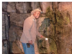
高森トンネル内を散策する筆者

旅の途中、ハイウェイを走るバスの車窓からは、田んぼや緑の草木、そして美しい花々を眺めることができ、それらの様々な色彩は私たちの目を大いに楽しませてくれました。しかし、これはまだ旅の始まりでしかなく、この後、まだまだ多くの素晴らしい光景に出会える筈であることを私たちは確信していました。