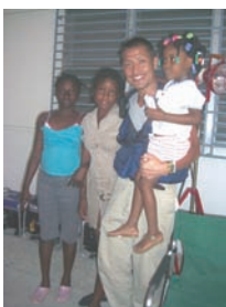
明るさを失わない人々

現地では一番印象に残ったことは、たいへんな被害を被ったにも関わらず、我々に笑顔で話しかけてくれる避難民キャンプの子供達や、私たちの活動を共に支援してくれた現地の看護学生さんの強さです。また、私が診療を担当した女の子が御礼を言いたいと、診療後に会いに来てくれたことがありました。それまで無我夢中で日々の診療に追われ、心に余裕が無かった私でしたが、この時、この地で頑張って活動し本当に良かったと思いました。