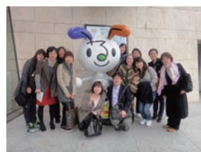
原爆資料館の玄関で

2 月 27 日、韓国カトリック医療協会研修（技師グループ）の長崎研修旅行に、薬剤科を代表して私たち 2 人が同行しました。毎年、韓国からの研修生を薬剤部で受け入れています。個人的には、これまでごく限られた時間しか研修生と接触する機会はありませんでした。今回、もっと長い交流の時間が持てればと思い、研修旅行の同行を希望したというわけです。