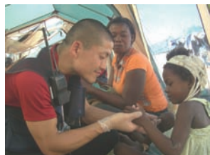
受付でのトリアージ

私は日本時間 1 月 13 日（水）に発生した中南米ハイチ地震災害の救援のため、2010 年 1 月 16 日～1 月 29 日の期間、国際緊急援助隊医療チーム（JMTDR）の一員として活動しました。活動地は首都（ポルトープランス）から約 40km 離れた、まだ他の医療チームが入っていないレオガン（人口約 10 万人）という都市でした。現地では暴動や略奪が頻発しており、危険なため、国連 PKO 活動中のスリランカ軍の護衛を受けながら、現地時間 18 日より診療活動を開始しました。