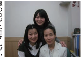
温かく迎えてくださった職員の方々

た。韓国は診療報酬が日本より安いので、病院の経営のためにも顧客管理が非常に重要視されており、「患者数を維持するために最善を尽くさなければならない」という意識が全職員に浸透しているように思われました。また職員間のコミュニケーションについても IT 化が進んでおり、電子決裁や職員間のチャットシステムなどが効果的に使われていました。