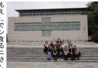
26 聖人殉教地の記念碑前にて

で、しだいに緊張も取れ、打ち溶け合えるようになりました。そして中華料理店での昼食では、チャンポンや血うどんの食べ方を教えてあげるうちに、よりコミュニケーションが促進され、仕事のことや、日本と韓国の文化の違いについてなど、いろんな話で盛り上がりました。また私と同じテーブルに薬剤師の研修生がいらしゃったので、日本と韓国における薬剤師の役割の違いや共通点について知ることができ、勉強になりました。