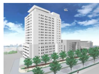
新棟建設中 (地上17階/地下2階)