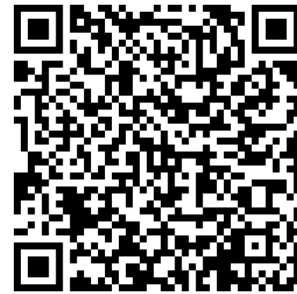
申し込みフォームのQRコード

1985年に東京大学医学部保健学科を卒業し、1990年に同大大学院医学系研究科保健学専攻博士課程修了。現在、聖路加国際大学大学院看護学研究科教授としてご活躍されている。ヘルスリテラシー（健康を決める力）、意思決定支援、ヘルスコミュニケーション、ポジティブコーピング、これらを支えあうサポートネットワークやコミュニティ、ソーシャルキャピタルづくりなどをテーマに多くの書籍を出版されている。